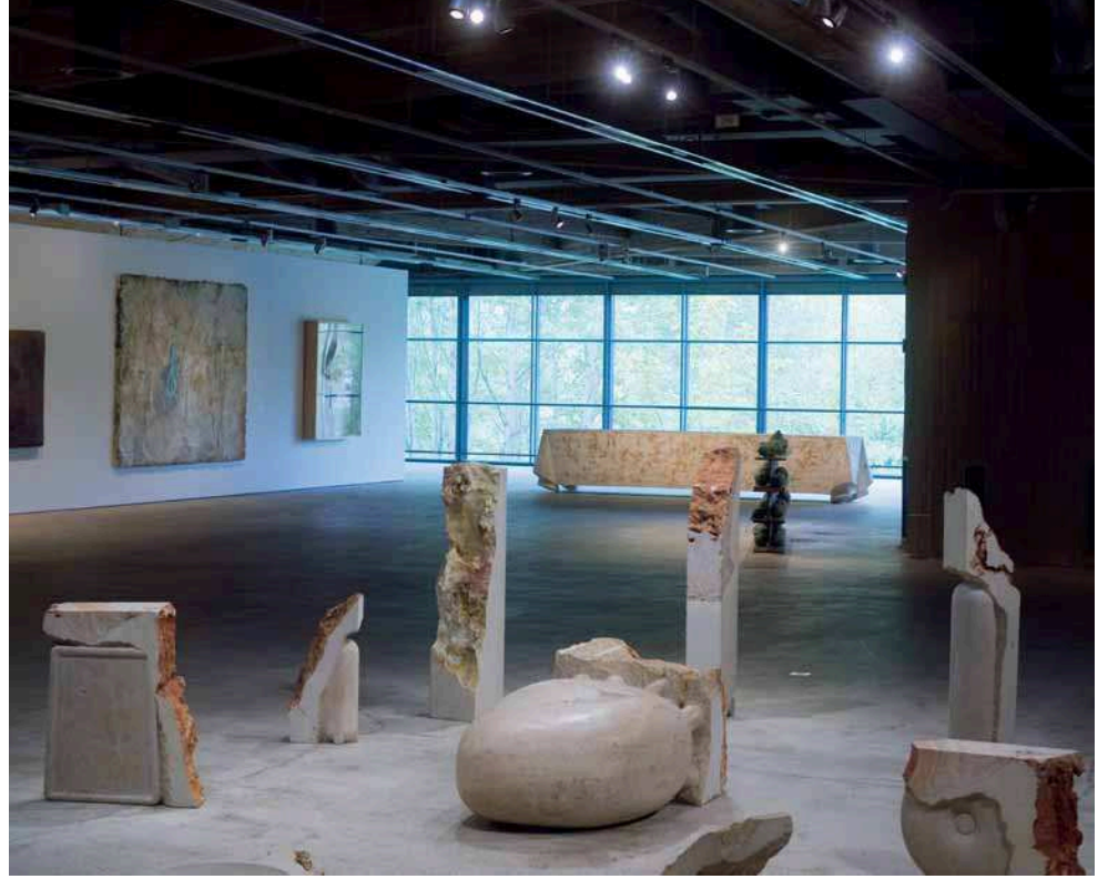
Ilkkunaseinä päästää myös luonnonvaloa hallitusti EMMA:n tiloihin. Tilateos on Tony Craggin "Sedimentti".

Näyttelyvalaistuksen hoitavat lähes 1 200 ERCO n kohdevalaisinta monipuolisia lisävarusteineen. Kohdevalaistuksessa on käytetty valaisimia Optec, Jilly, Pollux ja TM-Spot -sarjoista. Myös WeeGee-talon rakenteellisia osia on haluttu tuoda esille käyttäen T5-loistelampuilla varustettuja TFL-seinänpesijöitä ja Trion sarjan epäsuoria valaisimia.